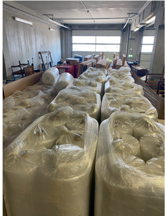
Schutzmaterial für ukrainische Museen, Foto: ICOM Österreich