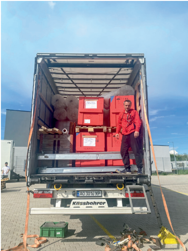
Von Wien nach Odessa, Foto: ICOM Österreich

von Kulturgut bei bewaffneten Konflikten. Denn: In der vielfältigen und reichhaltigen kulturellen Landschaft der Ukraine befinden sich, neben mehr als 400 Museen und 3000 Kulturstätten, insgesamt sieben UNESCO-Weltbestätten.